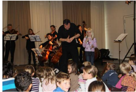
Einer von vielen etwas anderen Konzertorten

meration Bern wohnhaft. Im Rahmen des Projektes „Bildung und Kultur“ der Erziehungsdirektion des Kantons Bern reisten die Musikerinnen und Musiker der CAMERATA BERN wiederum mit dem Moderator Cyril Tissot durch den ganzen Kanton Bern und fragten knapp 1'500 Kinder: „ Wie schmeckt Mozart? “